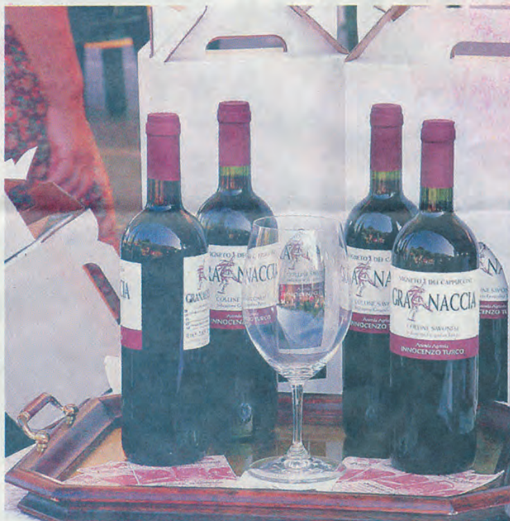
Successo della tradizionale manifestazione dedicata ai vini

L'altro appuntamento particolarmente atteso è la premiazione del concorso "Quiliano: fiori nel verde 2009". La manifestazione che coinvolge ogni anno abitanti, commercianti e scuole è arrivata alla decima edizione ed è sempre organizzata dal Comune di Quiliano in collaborazione